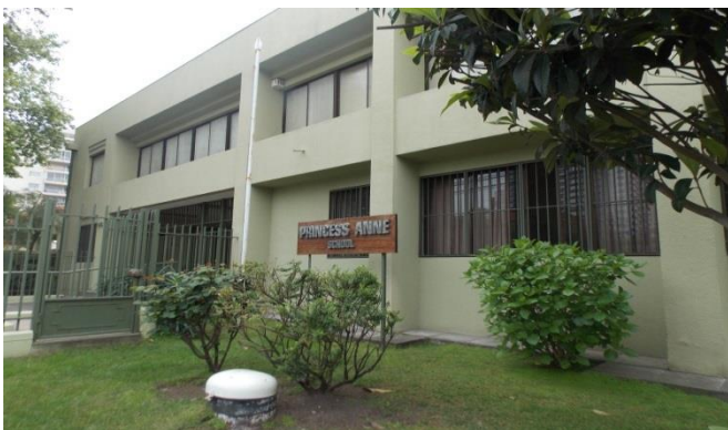
Ilustración 3: Sede Novena Avenida