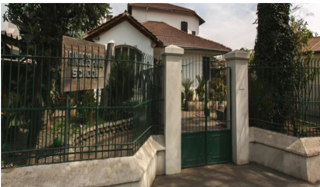
Ilustración 1: Casa Matriz