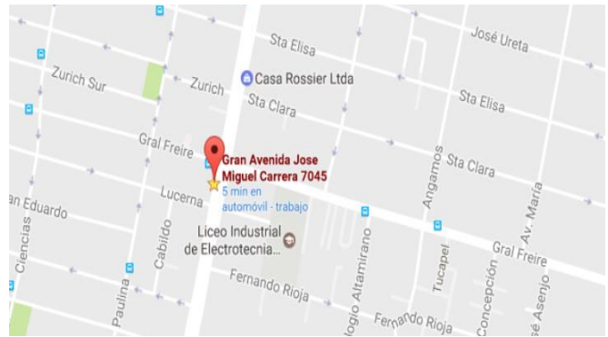
Ilustración 2: Acceso al Colegio por Gran Avenida José Miguel Carrera 7045. La Cisterna