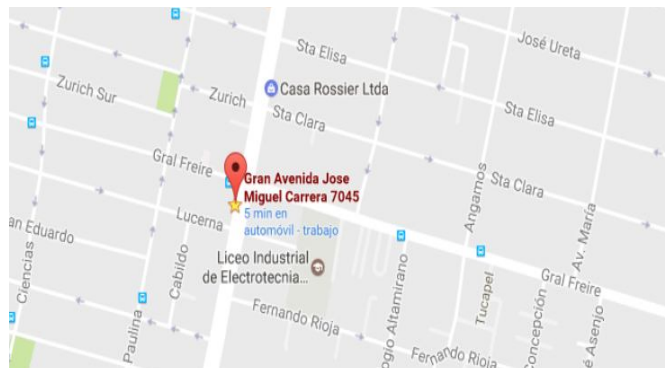
Ilustración 2: Acceso al Colegio por Gran Avenida José Miguel Carrera 7045. La Cisterna