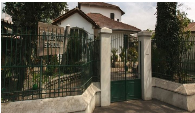
Ilustración 1: Casa Matriz